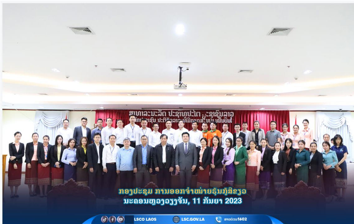
ຮູບພາບ 10 : ການຈັດກອງປະຊຸມສຳມະນາ ໃນຫົວຂໍ້: ວຽກງານ IFRS ລະຫວ່າງ ສຄຄຊ ຮ່ວມກັບ CPA Australia ແລະ ບໍລິສັດ ເອີນ ແອນ ຢັງ (ລາວ) ຈຳກັດ