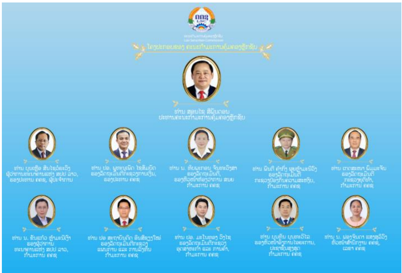
ຮູບພາບ 1: ໂຄງປະກອບບຸກຄະລາກອນຂອງ ຄະນະກຳມະການຄຸ້ມຄອງຫຼັກຊັບ

ຄຄຊ ໄດ້ເອົາໃຈໃສ່ປະຕິບັດໜ້າທີ່ຂອງຕົນ ໃນການຄຸ້ມຄອງ ແລະ ພັດທະນາຕະຫຼາດທຶນຂອງ ສປປ ລາວ ໃຫ້ມີປະສິດທິພາບ ໂປ່ງໃສ ແລະ ຍຸຕິທຳ. ການເຄື່ອນໄຫວໃນໄລຍະໜຶ່ງປີຜ່ານມາ ຄຄຊ ໄດ້ກຳນົດແນວທາງໃນການຄຸ້ມຄອງ, ພິຈາລະນາ ແລະ ຕິດຕາມກວດກາ ການເຄື່ອນໄຫວວຽກງານທີ່ຢູ່ພາຍໃຕ້ຄວາມຮັບຜິດຊອບຂອງຕົນຢ່າງໃກ້ຊິດ ໂດຍຜ່ານການພິຈາລະນາທາງເອກະສານ ແລະ ຜ່ານການຈັດກອງປະຊຸມຄົບຄະນະຂອງຄະນະກຳມະການຄຸ້ມຄອງຫຼັກຊັບ 02 ຄັ້ງ ເພື່ອພິຈາລະນາບາງບັນຫາທີ່ພົ້ນເດັ່ນ ແລະ ກຳນົດທິດທາງການຈັດຕັ້ງປະຕິບັດວຽກງານຈຸດສຸມໃນແຕ່ລະໄລຍະ. ພ້ອມນີ້, ໃນປີ 2023 ໄດ້ປັບປຸງຄະນະກຳມະການ ຄຄຊ ຈຳນວນ 02 ຄັ້ງ ເນື່ອງຈາກການປ່ຽນແປງດ້ານການຈັດຕັ້ງຂອງພາກສ່ວນກ່ຽວຂ້ອງ. ປັດຈຸບັນໂຄງປະກອບບຸກຄະລາກອນຂອງ ຄຄຊ ປະກອບມີ 11 ທ່ານ (ຕາມຮູບພາບ 1).