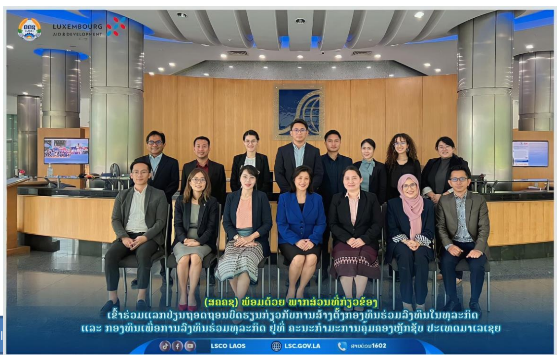
ຮູບພາບ 8: ການເຂົ້າຮ່ວມຝຶກອົບຮົມແລກປ່ຽນບົດຮຽນ ຢູ່ ມາເລເຊຍ

ໃນຮູບແບບສອງຝ່າຍ, ສຄຄຊ ໄດ້ຮ່ວມມືກັບ ສຄຄຊ ສປ.ຈີນ, ຫວຽດນາມ, ໄທ, ສະຖາບັນ IOD ໄທ, ສະຖາບັນ CPA Australia, ຕະຫຼາດຫຼັກຊັບໄທ ແລະ ລັດຖະບານລຸກຊຳບວກ ຢ່າງເປັນປົກກະຕິ. ອັນພື້ນເດັ່ນ ໄດ້ສຳເລັດການເຊັນບົດບັນທຶກຄວາມເຂົ້າໃຈຮ່ວມມືສອງຝ່າຍ ຮ່ວມກັບ ສຄຄຊ ກຳປູເຈຍ, ສຳເລັດການຂຶ້ນແຜນການຮ່ວມມື ແລະ ສະເໜີຂໍການຊ່ວຍເຫຼືອທາງດ້ານວິຊາການ ກັບ ສຄຄຊ ສສ.ຫວຽດນາມ, ສຄຄຊ ສປ.ຈີນ, ກລຕ ໄທ, ສຄຄຊ ກຳປູເຈຍ ແລະ ສະຖາບັນ CPA Australia ປະຈຳປີ 2023; ສຳເລັດການຈັດກອງປະຊຸມຮ່ວມມືສອງຝ່າຍປະຈຳປີ ລະຫວ່າງ ສຄຄຊ ຮ່ວມກັບ ສຄຄຊ ສສ.ຫວຽດນາມ ແລະ ສຄຄຊ ກຳປູເຈຍ, ສຳເລັດການຈັດຕັ້ງປະຕິບັດໂຄງການຮ່ວມມື ລະຫວ່າງ ລັດຖະບານລາວ ແລະ ລັດຖະບານລຸກຊຳບວກ (LAO/032). ພ້ອມນີ້, ພາຍໃຕ້ການຮ່ວມມືສອງຝ່າຍ ໄດ້ຈັດກອງປະຊຸມສຳມະນາຮ່ວມກັບ ສຄຄຊ ສສ.ຫວຽດນາມ, ກລຕ ໄທ, ສຄຄຊ ກຳປູເຈຍ, ສະຖາບັນ CPA Australia ແລະ ສະຖານທູດ ສ.ອາເມລິກາ ປະຈຳ ສປປ ລາວ ຜ່ານທາງອອນລາຍ ແລະ ກັບທີ່ ຢູ່ນະຄອນຫຼວງວຽງຈັນ ຈຳນວນ 9 ຄັ້ງ, 12 ຫົວຂໍ້ ໂດຍຜູ້ເຂົ້າຮ່ວມທັງໝົດ 378 ເທື່ອຄົນ. ນອກນີ້, ໄດ້ສຳເລັດການເຂົ້າຮ່ວມຝຶກອົບຮົມແລກປ່ຽນບົດຮຽນ ພາຍໃຕ້ໂຄງການລຸກຊຳບວກ (LAO/032) ໃນຫົວຂໍ້: ການຊຸກຍູ້ສິ່ງເສີມ ບັນດາທຸລະກິດຂະໜາດນ້ອຍ ແລະ ກາງ ເຂົ້າກະດານຮອງຂອງຕະຫຼາດຫຼັກຊັບ ຢູ່ ສສ.ຫວຽດນາມ, ຫົວຂໍ້: ການຄຸ້ມຄອງກອງທຶນເພື່ອການລົງທຶນຮ່ວມທຸລະກິດ (Venture Capital:VC) ແລະ ກອງທຶນເພື່ອການລົງທຶນໃນບໍລິສັດ (Private Equity:PE) ຢູ່ ປະເທດມາເລເຊຍ ແລະ 2 ຫົວຂໍ້ ຢູ່ ນະຄອນຫຼວງວຽງຈັນ ໂດຍມີຜູ້ເຂົ້າຮ່ວມທັງໝົດ 185 ເທື່ອຄົນ.